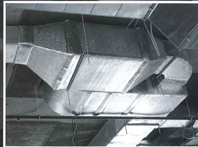
Москва. ТЦ «АБК»